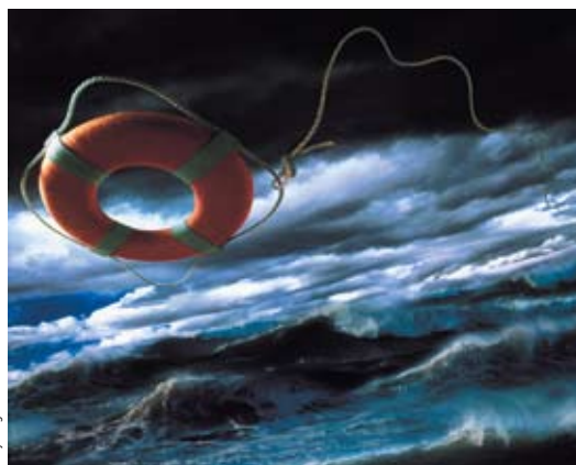
¿Salvación para el mercado solar español? Una prima progresiva para una instalación ya conectada, es decir, que aumente anualmente, evita altos costes iniciales en la subvención solar.

Por lo general, el legislador define una tarifa fija, que se paga durante un periodo fijo de 20 ó 25 años. Al fijar la tarifa se procede de modo que el propietario de la instalación recaude tanto dinero como para amortizar el precio de compra de su central más un interés apropiado sobre su capital propio, si la instalación funciona correctamente.