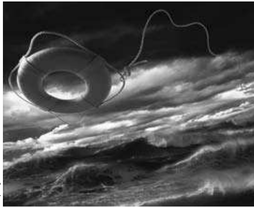
¿Salvación para el mercado solar español? Una prima progresiva para una instalación ya conectada, es decir, que aumente anualmente, evita altos costes iniciales en la subvención solar.

Por lo general, el legislador define una tarifa fija, que se paga durante un periodo fijo de 20 ó 25 años. Al fijar la tarifa se procede de modo que el propietario de la instalación recaude tanto dinero como para amortizar el precio de compra de su central más un interés apropiado sobre su capital propio, si la instalación funciona correctamente.